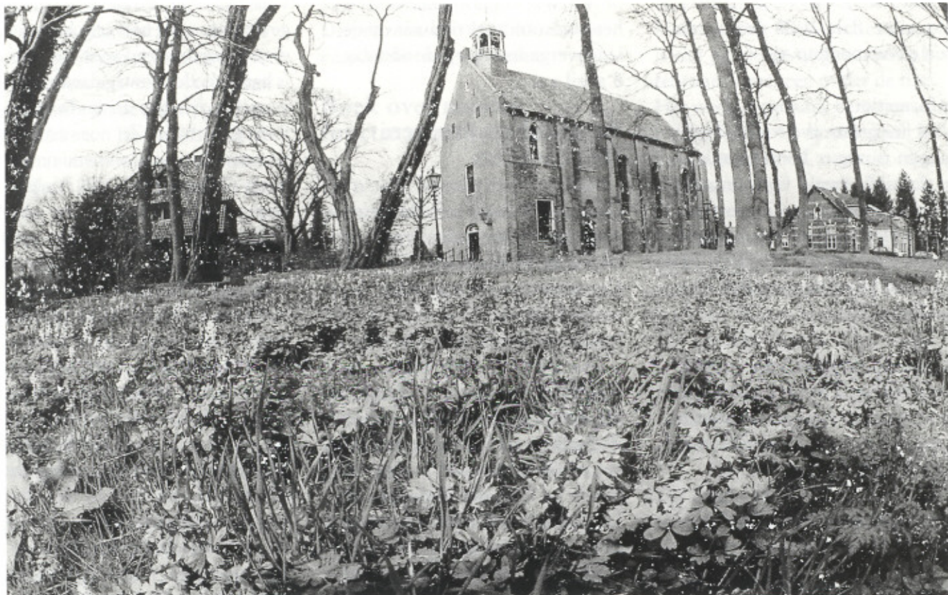
Het kerkplein met bloeiende holwortel in de vroege lente