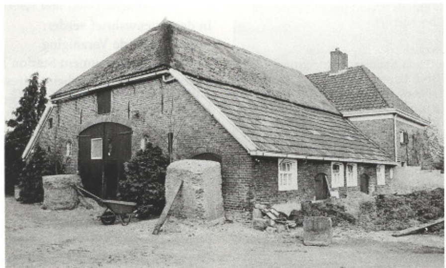
Boerderij 'De Regen', Schapenzandweg 15 b . Boven situatie 1999. Toenmalige bewoner fam. Harmsen. Onder situatie 2003. Huidige bewoner fam. Brand.

Dit mooie en historische boekje is bij de boekhandel te koop, o.a. bij Passe Partout (Oranjelaan) voor Euro 15,00.