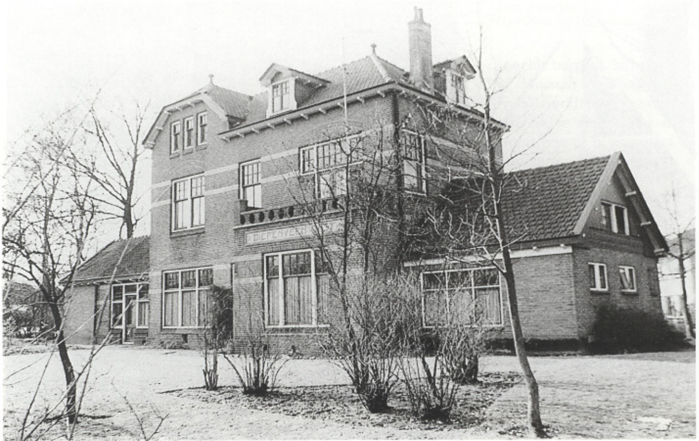
Voormalig station "Diepenveen-Oost". Later het Groene-Kruisgebouw.