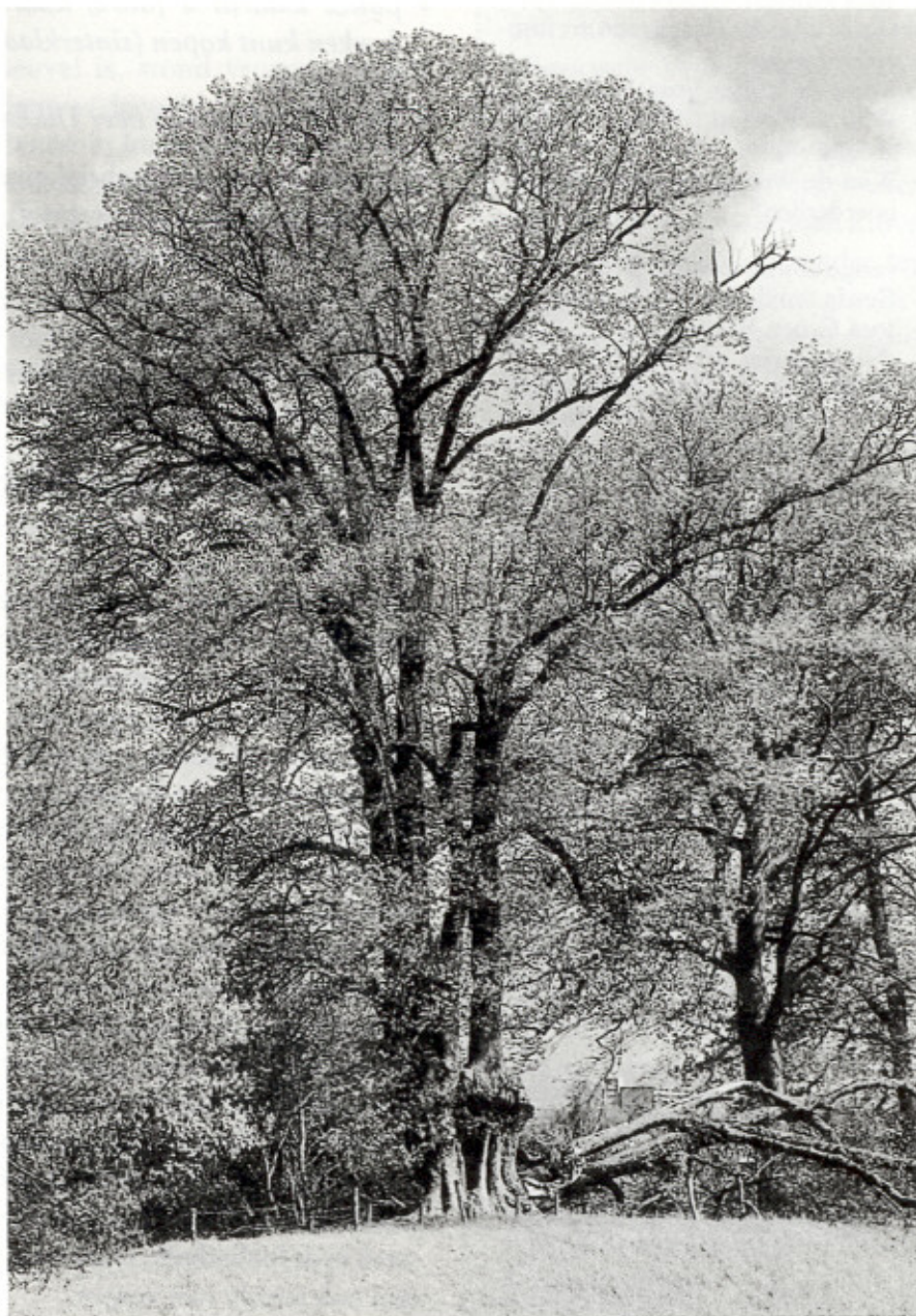
Kozakken Linde (1 mei 2002)

naar de Kozakken genoemd. Ook zijn er vele Kozakkenlinden. Bij Putten is een Kozakkenberg, in Epse een Kozakkenbult en tussen Diepenveen en Olst is een gebied dat het Kozakkengat heet.