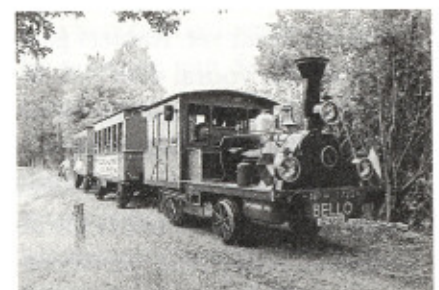
De OLD O herleefde

De website Diepenveen in oude ansichten op: http://members.home.nl/rudi.steenbruggen is sinds 26 september opgesierd met een keurmerk van de Historische Vereniging Dorp Diepenveen en Omgeving. Dat betekent dat de Historische Vereniging deze website van harte ondersteunt.