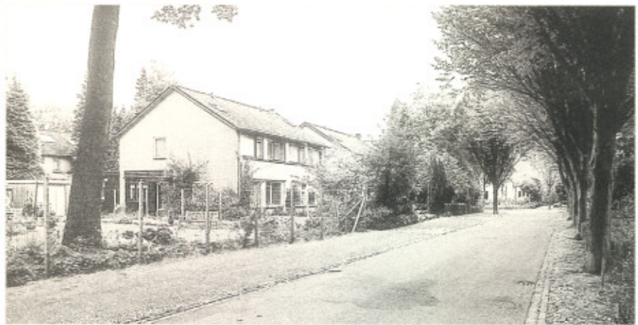
De Boschhoekweg in oktober 2005