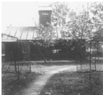
Het farmhuis met toren.

voordat ie de tweede barrière, het hoge hek rondom het hele terrein, op weg naar de vrijheid achter zich liet. Voor de kooien en de omrastering van het gehele Ravenbosch was zoveel materiaal nodig, dat er een eigen machine voor het produceren van gaas aangeschaft werd.