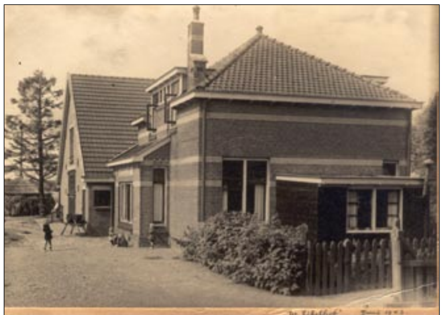
Station Eikelhof. Foto uit juni 1943

Coevorden. Toen de mogelijkheid zich voordeed om voor het OLDO-spoor te gaan werken, was hij er meteen voor te vinden. Vader was namelijk een echt buitenmens, hij hield enorm van de natuur en die was er volop in Eikelhof. Fazanten, konijnen, hazen, reeën, álles was er toen. Veel meer dan nu. We woonden ver van de bewoonde wereld. Er was alleen maar een karrenpad naar klooster Sion en naar Eikelhof. Ook mijn moeder was blij met haar betrekking als wachteres, het bracht extra geld in het laatje. Ze werd verantwoordelijk voor het wel en wee op deze halte. Ze moest er voor zorgen dat alles er goed verzorgd uitzag, ze