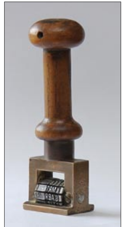
Slagstempel NS, gebruikt op Station Diepenveen Oost. Hiermee werden documenten en uitgaande post gedateerd. Januari 2010 geschonken aan onze vereniging door de heer Streefland uit Deventer.

Als Jo ’s middags met de trein weer thuis kwam mocht ze nooit meteen gaan spelen. Eerst moesten ze altijd een half uur ‘sokken breien’. Jo: “Toen ik ouder was moest ik ook sokken stoppen. Dat stoppen moest eindeloos gebeuren, het was vaak meer stop dan sok!” Iedere week moest Jo van moeder alle kopers deuren klinken van het sta-