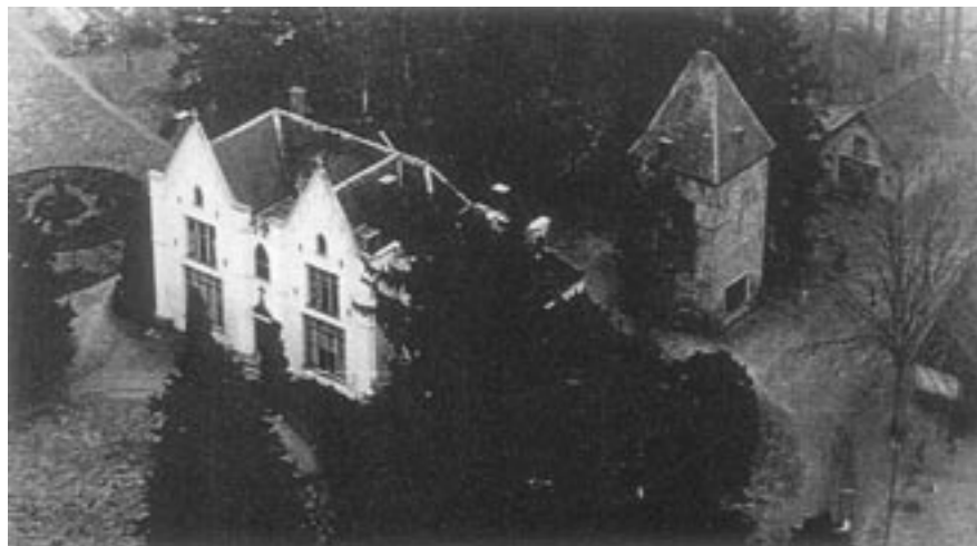
Het neogotische huis uit 1838 met de toren uit 1574. Deze luchtfoto werd genomen in 1953.