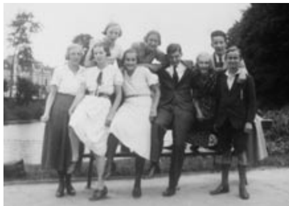
“Belloreizigers”. Foto genomen in 1933 bij de bank voor het station in Deventer.

Mijn Mulo-school was vlakbij drukkerij ‘de IJssel’ (nu is daar ‘n medisch centrum) in het gebouw van de Handelsschool. Ik liep altijd onder het viaduct door, en aan het begin van de Hoge Hondstraat moest ik linksaf en langs het spoor lopen naar mijn school. Een jaar