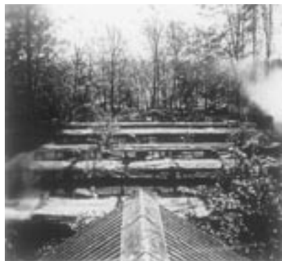
Gezicht op de vossenkooien vanaf de toren op het farmhuis.

In het midden van het perceel zijn eveneens een fors aantal bomen geroid voor een tweede bedrijfsgebouw en voor de aanleg van een boomgaard. Najaar 1936 kreeg Wichelmann toestemming “tot het bouwen van een houten gebouwtje afgedekt met riet dat dienst zal doen als keuringslokaal, bergplaats en kantoorruimte”. De stijl van dit ‘gebouwtje’ dat meer doet denken aan een woning dan aan een bedrijfsgebouw lijkt te wijzen op de zwierige hand van de bekende Deventer architect W.P.C. Knuttel. Dat laatste is overigens niet waarschijnlijk, want deze Knuttel was een beschermheer van mevrouw Klaare en zette bij de scheiding van het echtpaar Wichelmann-Klaare namens haar zijn