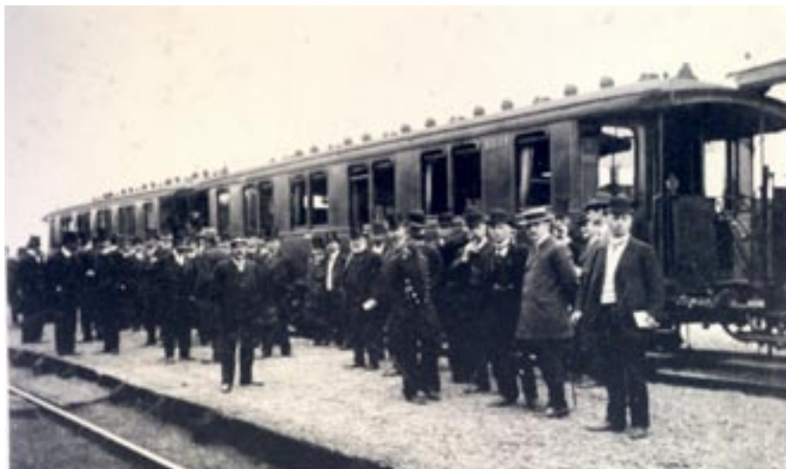
Opening lijn Stoomtrein Deventer-Ommen bij Station Oost aan de Boschhoekweg in Diepenveen.